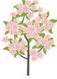
Meyve tutum evresi