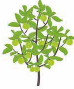
Meyvelerin aktif büyüme evresi