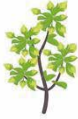
Çiçeklenmeye başlama evresi